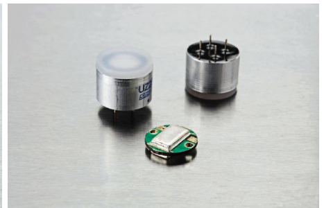
压电陶瓷超声波传感器