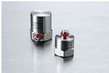
压电加速度传感器