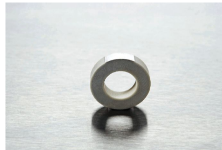
压电陶瓷能量发生器