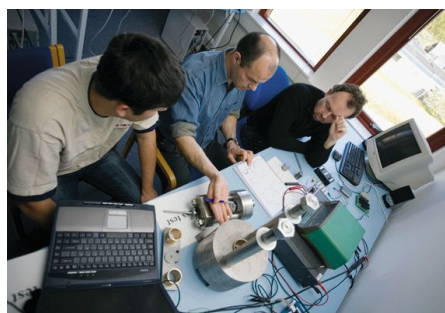
压电器件研究招标与投标