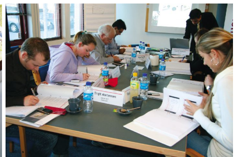
压电相关课程培训